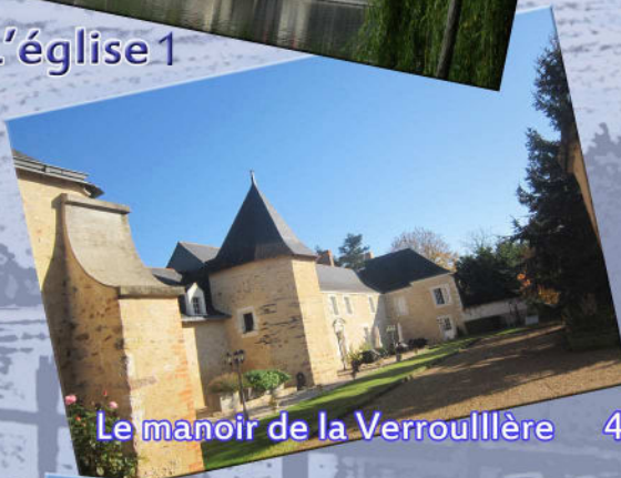
Le manoir de la Verrouillère 4