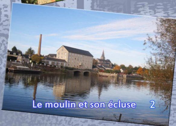
Le moulin et son écluse 2