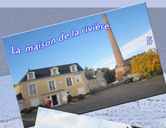
La maison de la rivière 5