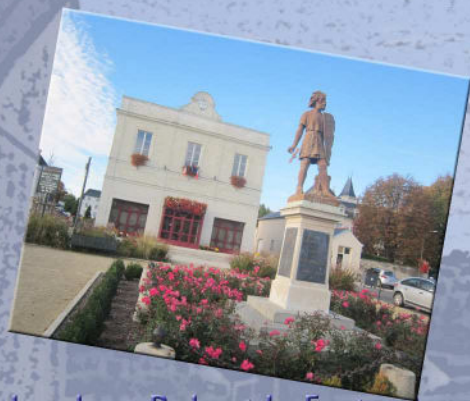
La place Robert le Fort 3