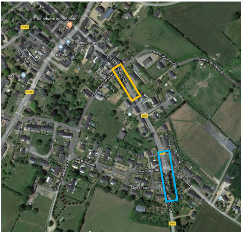
L'aménagement d'une écluse au niveau du chemin de Guérichault et chemin de Vaunaise

La commune des Hauts-d'Anjou a pour projet la mise en sécurité l'entrée d'agglomération. Ce projet prévoit l'aménagement d'un îlot séparateur en entrée d'agglomération et la requalification des stationnements devant les habitations ainsi que la mise en place d'une chicane au carrefour de la Vaunaise. Ces aménagements ont fait l'objet d'une concertation avec l'Agence Technique Départementale (ATD). Ce projet fait l'objet de plusieurs demandes de subventions (Dotation aux Équipements des Territoires Ruraux -DETR, amende de police).