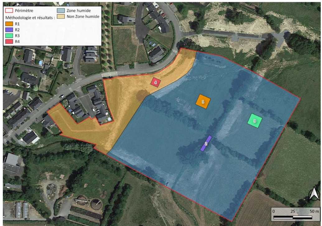
Figure 1 : méthodologie et résultats

DOMAINE DE LA COUDRE A CHAMPAGNE / COMMUNE DES HAUTS D'ANJOU INVENTAIRE ZONES HUMIDES : BOTANIQUE, HABITATS NATURELS