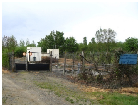
Station de traitement

La commune a fait réaliser une étude diagnostic réseau/station d'épuration. Ces dernières ont été confiées au bureau d'études SOGREAH PRAUD.