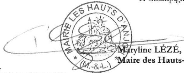
Maryline LÉZÉ, Maire des Hauts-d'Anjou

Pour extrait certifié conforme A Champigné, le 18 octobre 2024