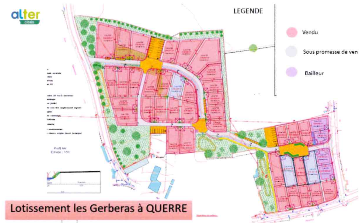
Schéma d'aménagement initial et état des cessions au 31 décembre 2023 :