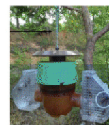
Piège coréen à ailes